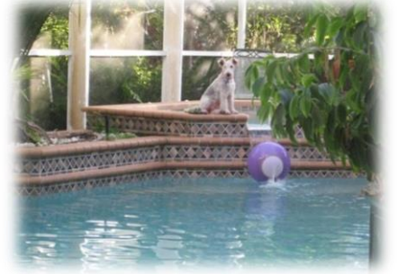
Ein Bild von unseren geliebten Hunden musste mit auf diese Seite