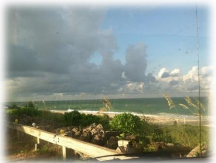
Casey Key, "unsere" Insel and der Westküste von Florida mit atemberaubenden Wolkenformationen und Regenbögen