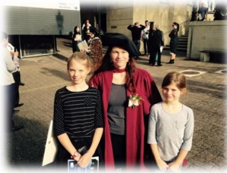
Die Mutter wird mit den höchsten akademischen Würden geehrt