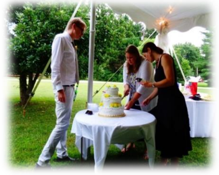
Die Torte der goldenen Hochzeit wird von den Kindern zerteilt