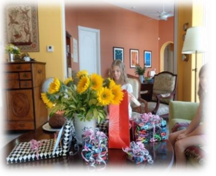
Syrachs Geburtstag bei uns