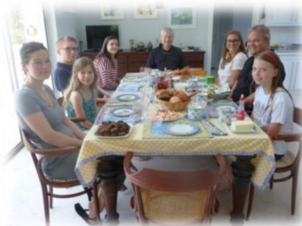
Im Juni hatten wir eine Familien Reunion bei uns auf Casey Key